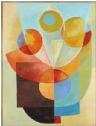
Sommerspiel, 1964, 113 x 84 cm