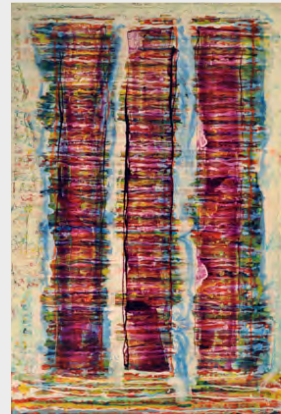
Hans Jürgen Diez „o. T., Nr. VI“, 2013, Acrylmischtechnik auf Leinwand, 190 x 130 cm