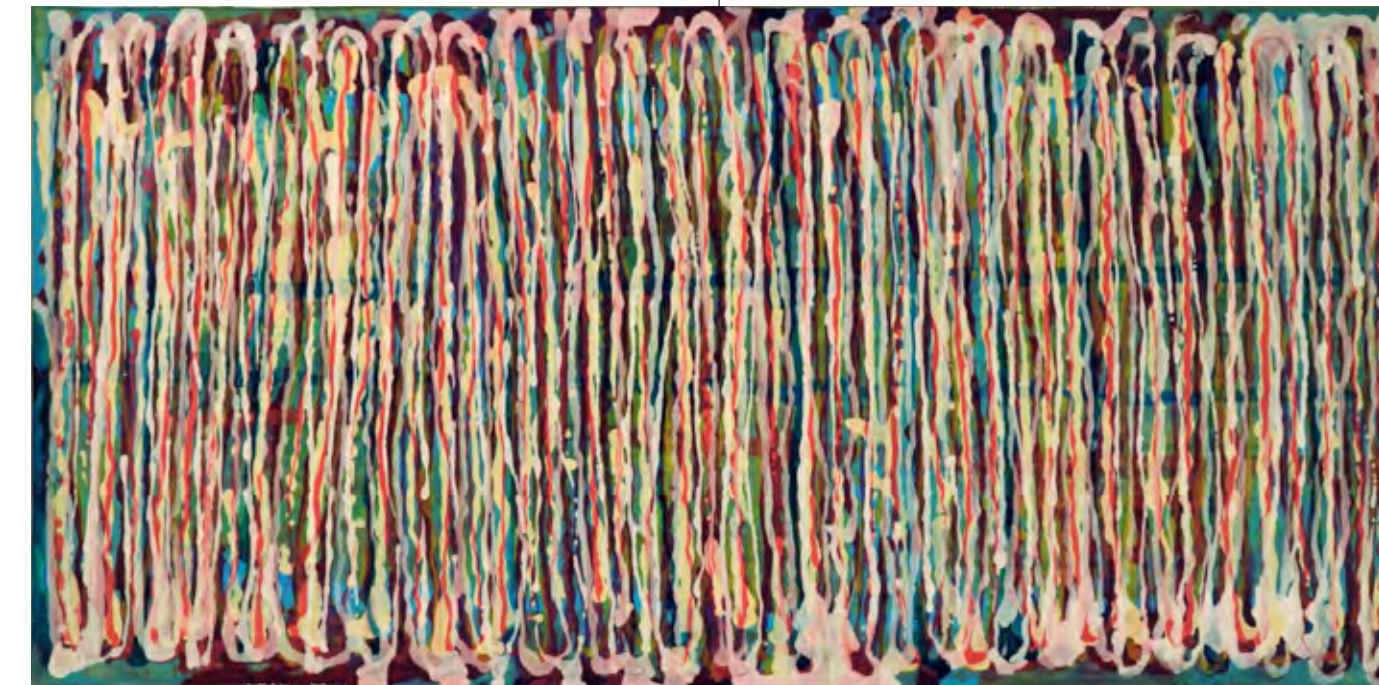
Hans Jürgen Diez „o. T., Nr. IX“, 2012, Acrylmischtechnik auf Leinwand, 90 x 190 cm