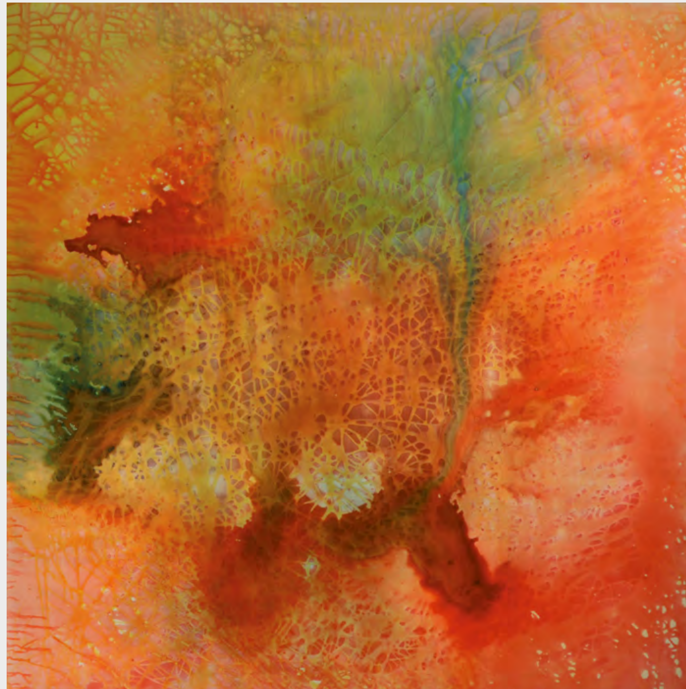
Hans Jürgen Diez „o. T., Nr. I“, 1989, Acrylmischtechnik auf Leinwand, 200 x 190 cm

www.hansjürgendiez.de www.diez.homepage.t-online.de